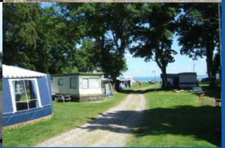
Februar 2015—Layout: Bettina Kjør—Trykning: Jan Bendix a/s.