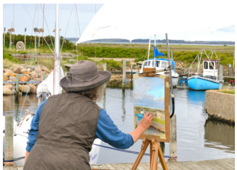
April 2025 - Layout: Bettina Kjer - Drucken: Jan Bendix a/s