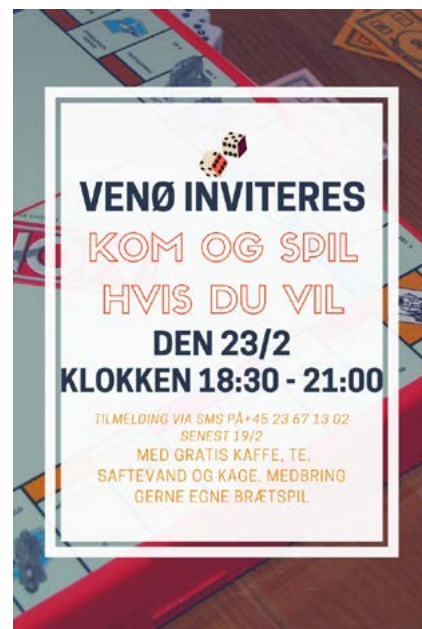
Brætspilsaftenen afholdes i fællessalen på Venø Efterskole / Red.