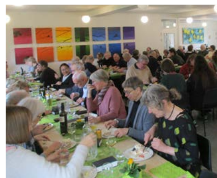
Billeder fra indsættelsen den 29. januar.