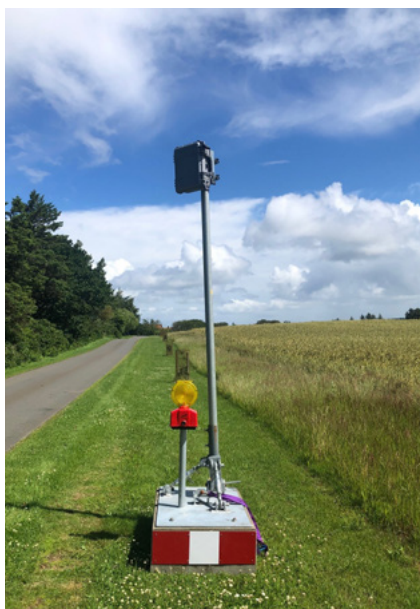
Laserstanderen ved tidligere måling på Venø.